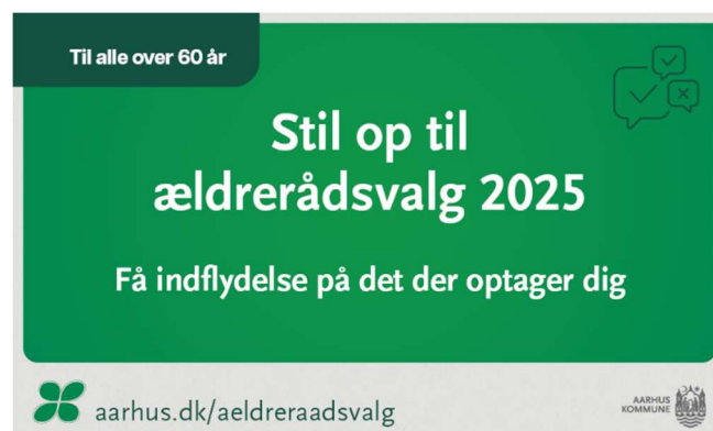
Eksempel på kommunikationsmateriale på LED-skærm.

Alle de opstillede kandidater fik taget ensartede portrætbilleder til brug i kommunikationsmateriale på blandt andet hjemmesiden og i Vital. Der blev den 23. september fra klokken 16-17 afholdt informationsmøde for de opstillede kandidater om valghandlingen og muligheden for at føre valgkamp. Her blev de også tilbudt 1.500 flyers hver med en forside om dem som kandidat og en ens bagside med information om selve valget. Alle kandidater takkede ja til flyer, som Sundhed og Omsorg fik produceret.