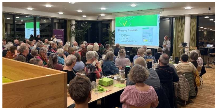
De frivillige til informationsmøde på Grøndalsvej.

afholdt et informationsmøde i kantinen på Grøndalsvej 2 den 11. november klokken 17-18.