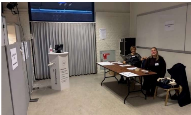
Eksempel på skiltning i Vejby Risskov Hallen.

“Større skilte om ældrerådsvalet og gerne et banner eller beachflag – vi blev overset, fordi vi stod for langt væk.”