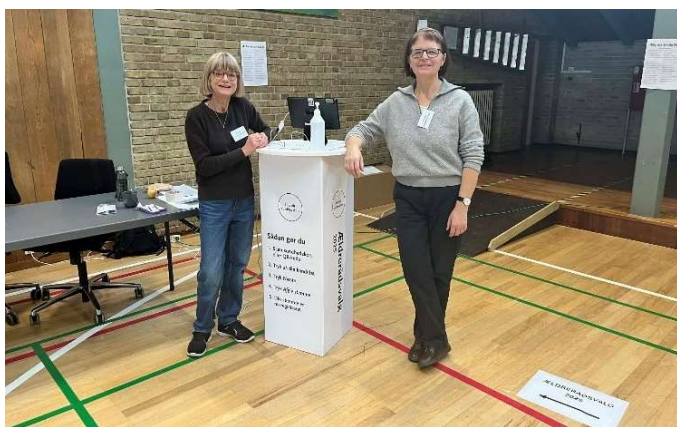
De frivillige til ælde-rådsvalet ved siden af stemmeenheden på Vorrevang Skolen.

Ved gennemgangen sikrede Sundhed og Omsorg også, at tilgængeligheden ikke var en udfordring. De steder, hvor der var udfordringer med tilgængeligheden, hjalp frivillige ved behov for assistance. Udgangspunktet var, at en vælger selv skulle afgive sin stemme, men havde en vælger behov for hjælp, kunne vælgeren enten få hjælp af de frivillige eller en ledsager. Det var ikke muligt på valgdagen at håndtere vognstemmer. Dog kunne en vælger få to frivillige til at afgive sin stemme for sig.