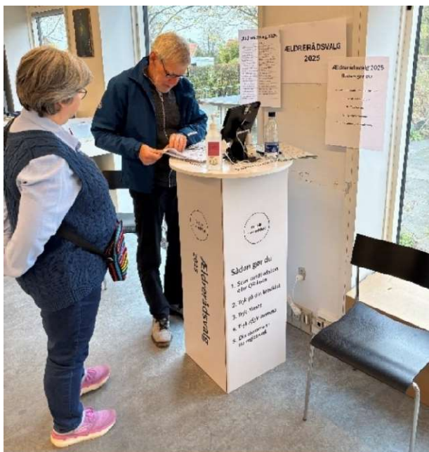
Brevstemmemuligheden på Risskov bibliotek.

Brevstemmemuligheden fulgte brevstemmemulighederne til kommunal- og regionsrådsvalget dog med undtagelse af muligheden for at brevstemme på Dokk1 allerede fra 7. oktober. Dette blev fravalgt, da tallene fra tidligere valg viser, at der modtages et fåtal af brevstemmer de tre første uger af brevstemmeperioden. Det blev derfor vurderet som unødvendigt til ældrerådsvalget.